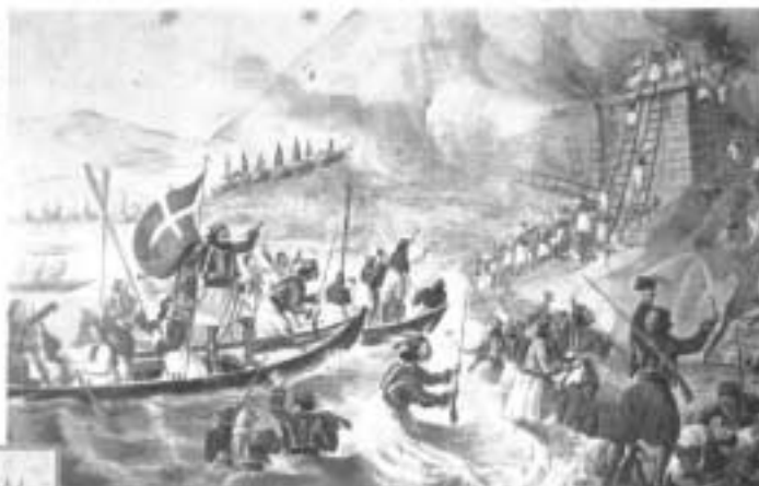
Η πολιορκία του Κάστρου της Μονεμβάσιος το 1821. Πίνακας του Αλεξ. Ηλιάδη. Εθν. Ιστορ. Μουσείο.