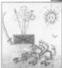
Η σφραγίδα που χρησιμοποίησε ο Πάριος Τζανουάκης το 1821 στην πολιορκία του κάστρου. Εθνικό Ιστορικό Μουσείο.